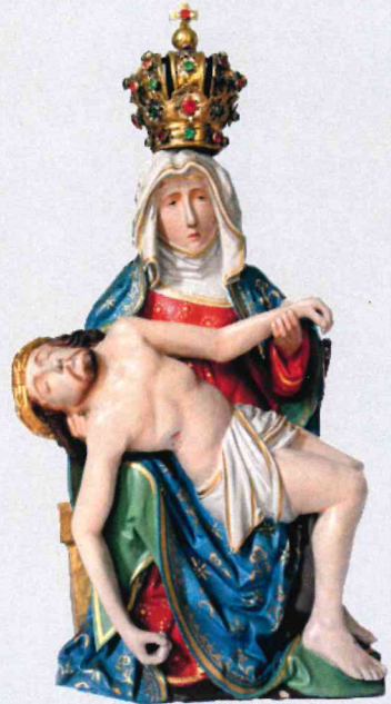
Meine Zeit steht in deinen Händen. Nun